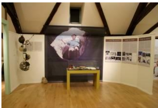
A karsztok és barlangok világa

A repülőtérről a látogató végre kiér a nagyvilágba, ahol tematikus egységekbe rendezve ismerkedhet meg a Balázs Dénes által kutatatott öt természetföldrajzi téma; a barlangok, a sivatag, az őserdő, a jég és a vulkánok világával. 28 darab, eredeti Balázs Dénes által készített fotókkal, ábrákkal illusztrált tablók segíti az eligazodásban. A tablók egyrészt általános ismertetését adják a fenti témáknak, illetve kifejtik a geográfus jelentőségét, munkásságának eredményeit az adott témakörben.