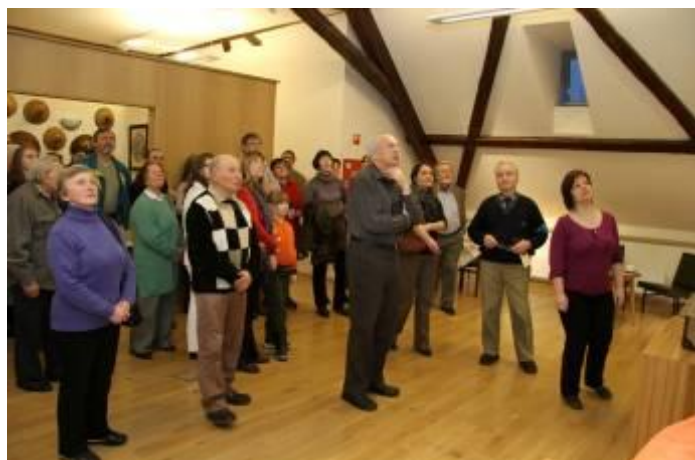
A kiállítás megtekintése