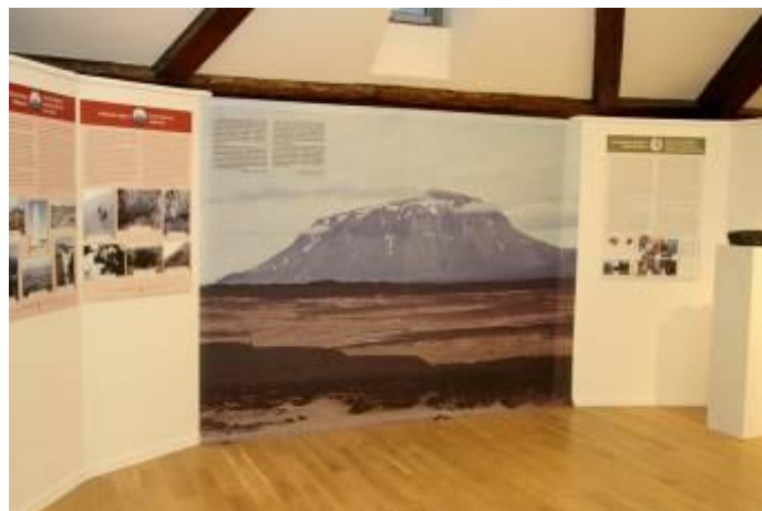
Vulkánok hátán és mélyén

Egy külön egységében megjelenik a lokálpatrióta, aki igen sokat tett városa természeti értékeiének földrajzi - földtani jellegzetességeinek közkinccsá tételéért, és a múzeumalapító, aki 1983-ban hozta létre e kiállításnak is helyet adó intézményt.