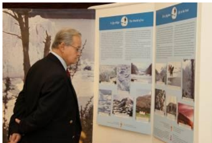
A jég világa