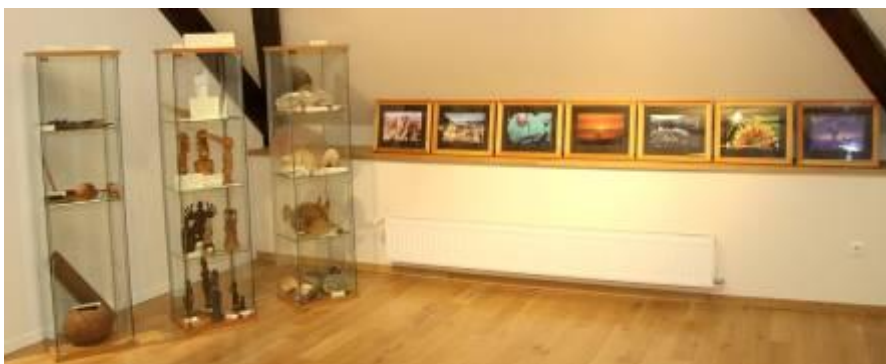
A vámmentes bolt kínálata

A repülőtérről a látogató végre kiér a nagyvilágba, ahol tematikus egységekbe rendezve ismerkedhet meg a Balázs Dénes által kutatatott öt természetföldrajzi téma; a barlangok, a sivatag, az őserdő, a jég és a vulkánok világával. 28 darab, eredeti Balázs Dénes által készített fotókkal, ábrákkal illusztrált tablók segíti az eligazodásban. A tablók egyrészt általános ismertetését adják a fenti témáknak, illetve kifejtik a geográfus jelentőségét, munkásságának eredményeit az adott témakörben.