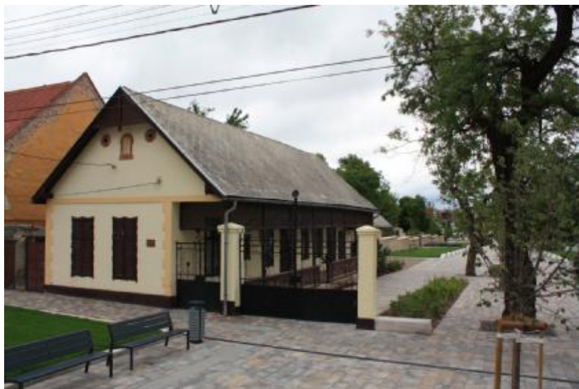
Az érdi Helytörténeti Gyűjtemény épületének utca felőli homlokzata

A Magyar Földrajzi Múzeum gyűjtőköre 2008-ban kibővült a Helytörténeti Kiállítás létrehozásával, mely a Felső u. 3. szám alatti épületben került elhelyezésre Érd Város Önkormányzat Képviselőtestülete 26/2004. (II.26.) ÖK számú határozatában foglaltak alapján.